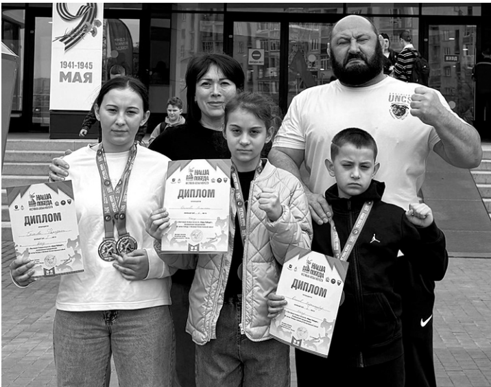
Дружная семья Бестовых