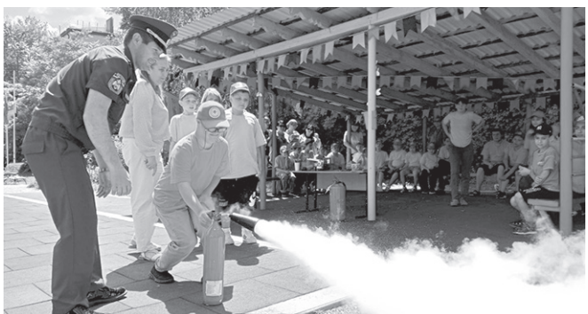
Школьники с интересом познакомились со спецтехникой

В эти дни специалисты Управления надзорной деятельности и профилактической работы ГУ МЧС РФ по КЧР совместно с огнеборцами 1-ой пожарно-спасательной части города Черкесска провели показ техники и обучающее мероприятие в одном из пришкольных лагерей города Черкесска. В рамках встречи специальные продемонстрировали учащимся возможности специальной техники, рассказали, к чему может привести детская шалость с огнем, и как нужно действовать в случае обнаружения возгорания.