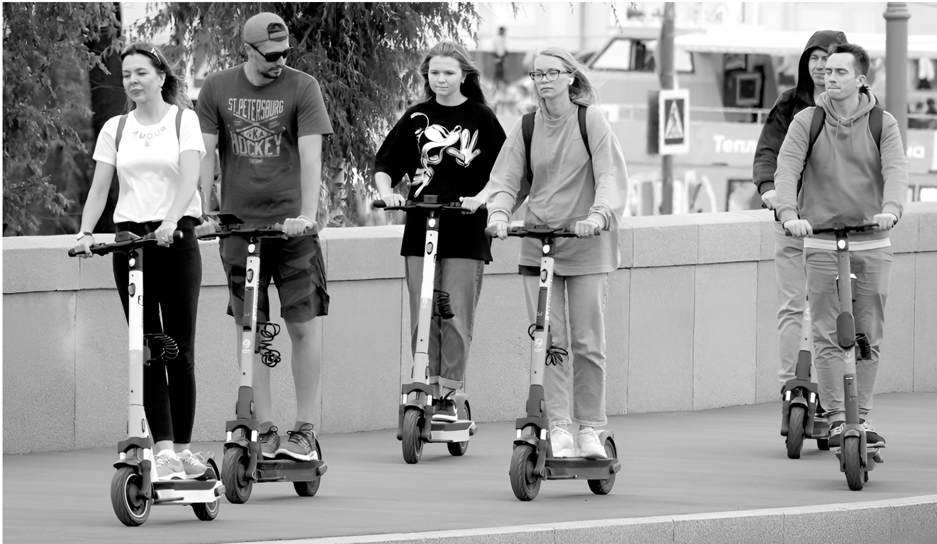
Электросамокаты набирают все большую популярность

— За нарушения правил использования СИМ наступает административная ответственность. За нарушение неспешивания на пешеходном переходе и создание помех другим участ-